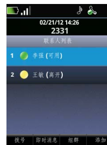
图 7：SpectraLink 8400 系列上的 Microsoft Lync 联系人列表