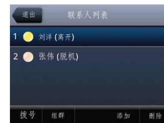
图 8：VVX 500 上的 Microsoft Lync 联系人列表