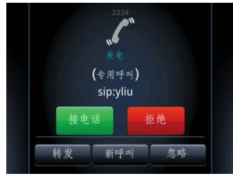
图 17: 在 VVX 500 上应答专用呼叫