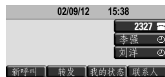
图 4：查看 SoundPoint IP 450 的主屏幕