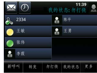
图 12: SpectraLink 8400 系列上的 Microsoft Lync 联系人列表