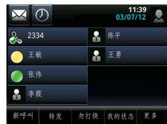
图 5：查看 VVX 500 上的主屏幕