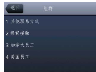
图 6：在 VVX 500 上查看组