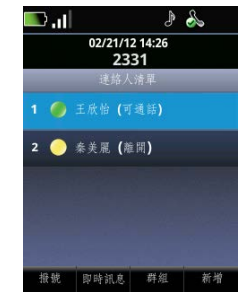
圖 7：SpectraLink 8400 系列上的 Lync 連絡人清單