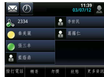
圖 5：在 VVX 500 上查看主畫面