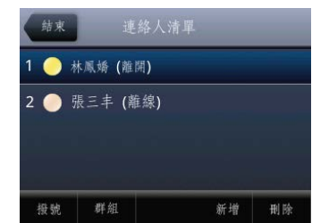
圖 8：VVX 500 上的 Lync 連絡人清單