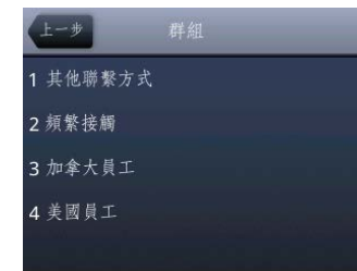
圖 6：在 VVX 500 上查看群組