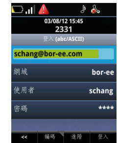
圖 2：在 VVX 500 上登入