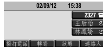
圖 4：在 SoundPoint IP 450 上查看主畫面